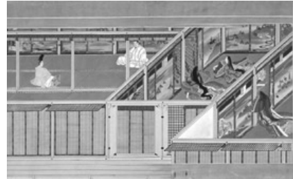
春日権現霊験記絵巻(部分)詞書:近衛家照筆 画:渡辺始興筆 京都・陽明文庫蔵