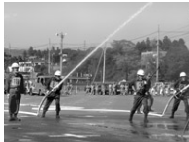
準優勝した第3分団

9月22日(土)に東京サマーランドファミリアパーク駐車場で、消防操法大会が行われました。 審査の結果、あきる野市消防団からは、小型動力ポンプの部に出場した第4分団が優勝し、第3分団が準優勝しました。 優勝：青梅市消防団 準優勝：あきる野市消防団第3分団 第3位：奥多摩町消防団 問合せ 地域振興課交通防災係(内線2342)へ