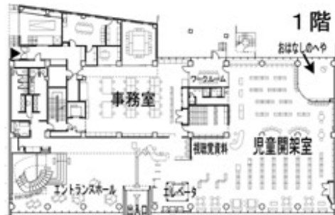
中央図書館 平面図