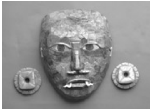
王の翡翠の仮面(カンペチエ博物館蔵)

日時 6月30日(土) 午後2時~午後1時30分開場 場所 中央公民館 内容 マチュピチュの遺物やアンデスのミイラをはじめ、展示品のほとんどが日本で初めて公開される。失われた文明「インカ・マヤ・アステカ」展。この展覧会にあわせ