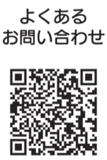
よくあるお問い合わせ