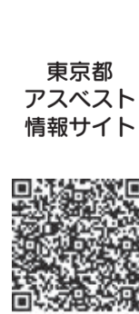
東京都アスベスト情報サイト