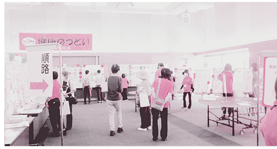
第25回 健康のつどいの様子(令和4年)

供、めざせ健康あきる野21のPR、各種相談(保健、栄養、歯科、薬などに関する健康相談)、骨密度測定、愛の献血、あきる野市消防団のPRなどを行います。