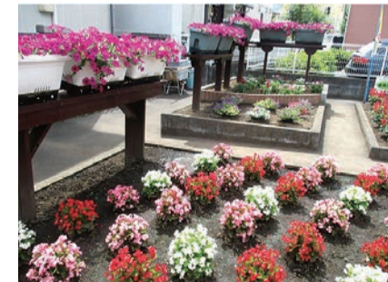
道路部門 金賞花壇 三内自治会