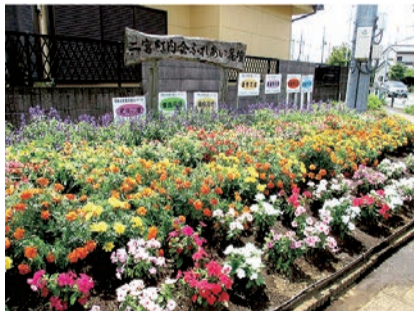
道路部門 金賞花壇 二宮町内会