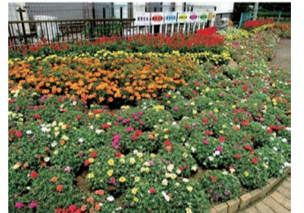
公園・広場部門 銀賞花壇 富士見台自治会