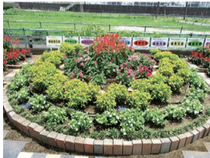
公園・広場部門 金賞花壇 油平自治会