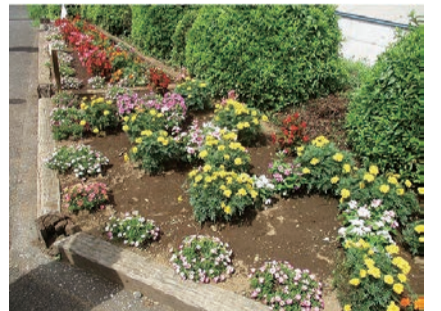
道路部門 銀賞花壇 留原自治会