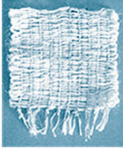
アングインコースター

①まが玉づくり：古墳時代のアグセサリを簡単に楽しめる方法で作ります。 ②アングインでコースター作り ▽日時 ①8月10日(木) ②8月13日(日) ※①②とも午後1時～3時 ▽場所 二宮考古館 ▽講師 文化財係職員 ▽対象 小学生以上 ※小学校4年生以下は保護者同伴 ▽定員 16人(抽選) ②1016人(抽選)