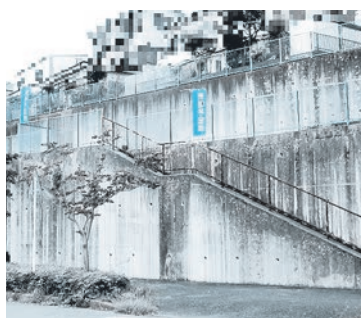
南側道路から撮影