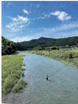
銀賞 盛夏!秋川! / カムさん