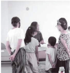
昨年度の親子講習会の様子

ダンボール方式コンポストは、菌や微生物などの力で、生ごみを分解し、たい肥を作ることができます。夏休みの自由研究として、親子で生ごみの減量と堆肥化に取り組んでみませんか。コンポストの基材は、土に混ぜて堆肥として使用できます(講習会終了後に1組につき1つのダンボール方式コンポストを渡します)。