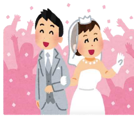
婚姻(令和3年度) 1日に0.6組