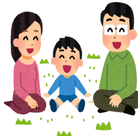
人口密度(令和5年1月1日) 1Km 2 あたり1,086人