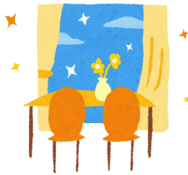
転入(令和4年) 1日に8.0人