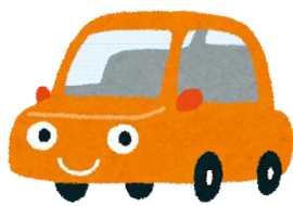
自動車保有台数(令和2年度末) 1世帯当たり0.8台