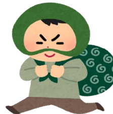
犯罪(令和3年) 1日に3.2件 (五日市・福生警察署管内)