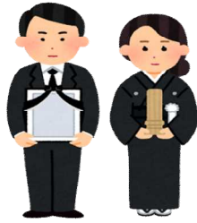
死亡(令和4年) 1日に3.0人