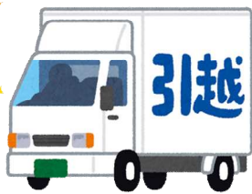
転出(令和4年) 1日に7.0人