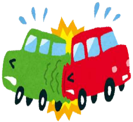
交通事故(令和3年) 1日に1.6件 (五日市・福生警察署管内)