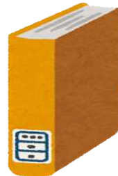
図書館蔵書数(令和3年度末) 市民1人あたり7.9冊