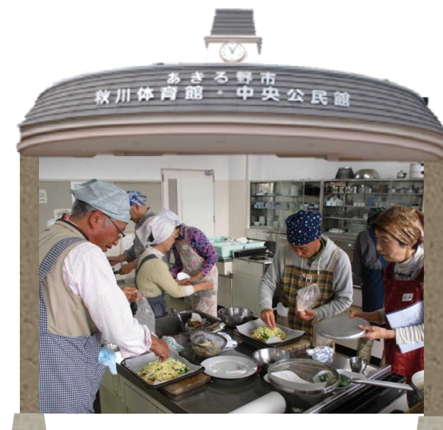
令和元年度市民大学「男性の料理教室」の様子