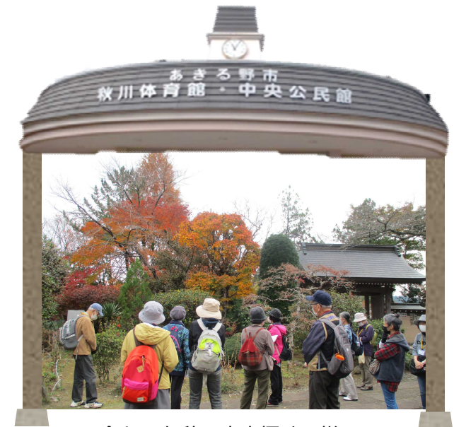
令和3年秋の市内探訪の様子 「秋の山里 戸倉城山を歩く」