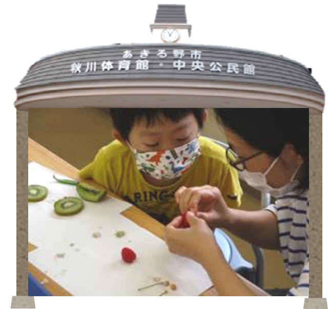
青少年教室「科学教室」の様子