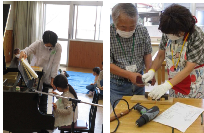
令和3年度市民企画講座の様子