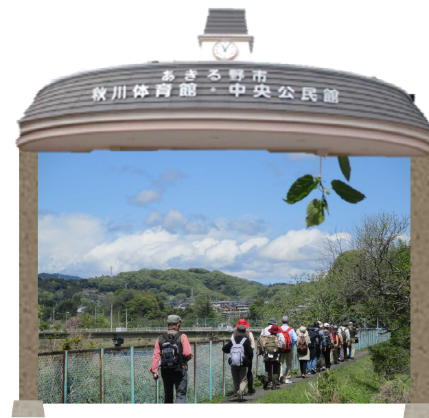
令和4年度春の市内探訪の様子「緑風薫る引田散策」