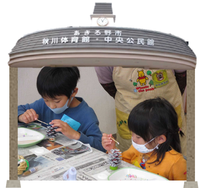
令和3年度家庭教育講座親子工作教室の様子