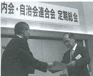
退任される南連合会会長に感謝状を贈呈

今後とも、行政ご当局をはじめ、連合会会員各位のご指導ご協力を賜りますようお願い申し上げます。