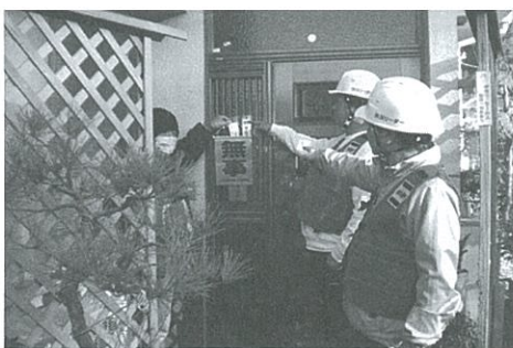
安否確認訓練 (安否確認旗)

地域住民の価値観の相違や核家族化、少子高齢化、ライフスタイルの変化に伴う地域コミュニティの希薄化が進んでいます。そのため、各町内会長、自治会長、防災リーダーを中心に地域の特性に合ったミニ防災訓練から始めました。近隣の町内会・自治会、学校、消防団、各種団体の協力において、自分達を取り組んできた防災訓練が大きな輪となり認定されたものです。