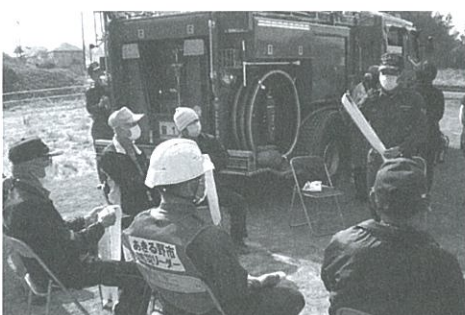
消防署・消防団から三角巾の取扱い指導