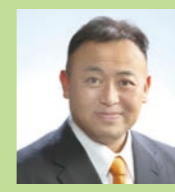
うすい けん 【自由民主党 志清会】 白井 建