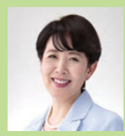
おおく ぼまさよ 【公明党】 大久保 昌代