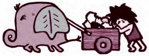
げん人くんとヘラスゾウ

西秋川衛生組合に直接ごみを持ち込みます。年末年始は、大変混雑が予想されます。ごみ収集車との混乱を避けるため、受入れを次のように行います。 ●年末年始 12月25日(水) 午後4時 ●年始 令和2年1月6日(月) 午前9時から ▽対象 市民(個人)に限りません。 ※運転免許証などで本人確認します。 ▽持ち込みができるごみ 可燃・不燃・粗大ごみです。それぞれ分別して持ち込んでください。(資源や有害ごみ、事業所ごみなどは不可)。 ▽その他 詳しくは、西秋川衛生組合ホームページ (http://www.nishikigawa.or.jp/) で確認するか、電話でお問い合わせください。 ▽問合せ 西秋川衛生組合 (☎596・4418)、(株)たかお環境サービス (☎519・9362)