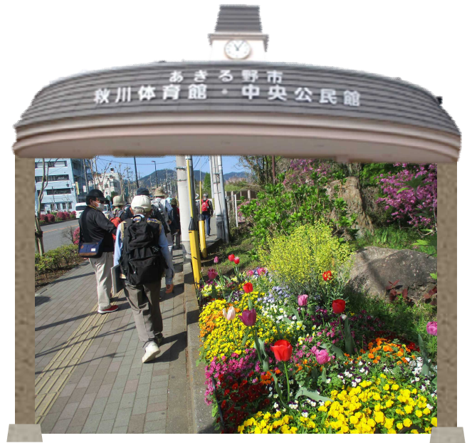
令和5年度 春の市内探訪の様子 「春の花と石造物めぐり」でかけよう！五日市春の散歩道」