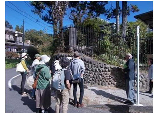
令和5年度市民企画講座「親子で学ぼう あきる野の歴史」

※詳細は市民企画講座募集案内をご覧ください。募集案内と申請書は、中央公民館で配布します。市HPからもダウンロードできます。