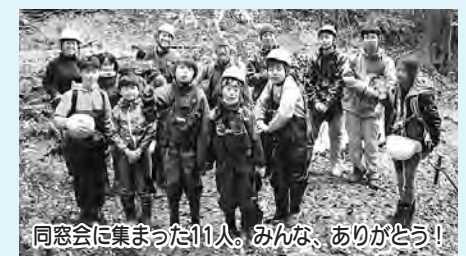
同窓会に集まった11人。みんな、ありがとう!

イノシシのヌタ場となっていた場所には、産卵にくる両生類や昆虫などが戻り、生態系のバランスを保つ役割を持っている捕食者のキツネやイタチ、フクロウ、ヘビなどが利用するようになりました。イノシシは、地元の猟師さんのおかげもあり減少してきました。周辺の森はメダケや