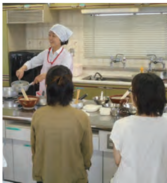
こども離乳食教室