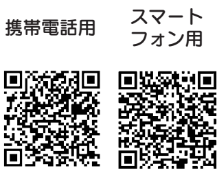
スマートフォン用