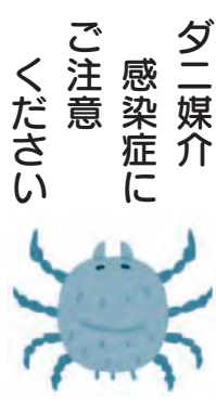
ダニ媒介 ご注意 ください

●アシナガバチなど:穴がいくつも開いている。 ▽巣の駆除 ●個人で駆除する場合:市で防護服の貸し出しをします。 ●駆除業者に依頼する場合:職業別電話帳の「消毒業」の業者などに、相談してください。 ※市では、ハチの巣の駆除を行っていません。 ▽害虫(ハチなど) 駆除の無料相談 東京都ベストコントロール協会 ☎03・3254・0014