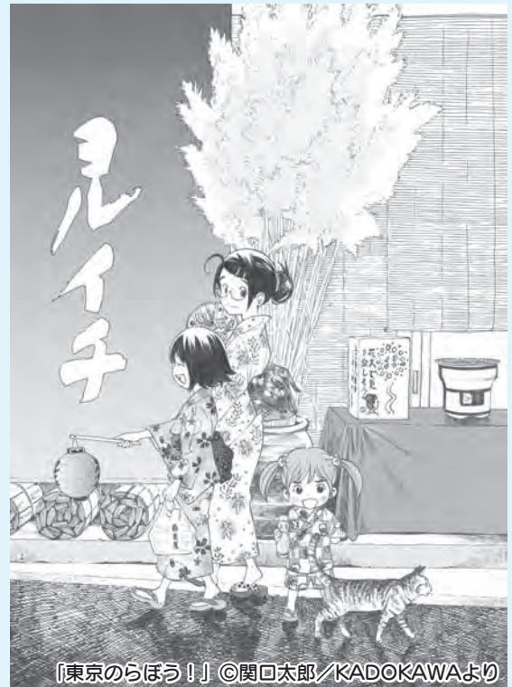
「東京のらぼう!」©関口太郎/KADOKAWAより

▽開催場所 武蔵五日市駅周辺から小中野交差点までの檜原街道沿いで主に次の場所で開催されます。 ●檜原街道沿いの既存店、模擬店の出店 ●五日市ひろば ●JAあきがわ五日市支店駐車場 ●五日市郷土館敷地内