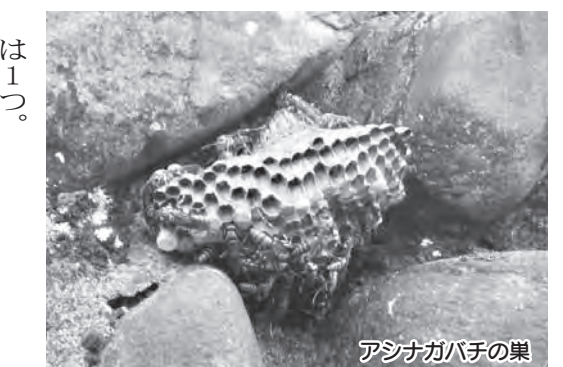
アシナガハチの巣

今年は雨が少なく、ハチの活動が活発であり、ハチによる被害も発生しています。知らずに巣を刺激してしまうと大変危険ですので、ハチの巣がでやすい場所に、注意してください。 ▽巣がでやすい場所 軒下、雨戸の戸袋、エアコンの室外機、換気扇のダクト内や庭木(葉の密集した木)、朽ちた木 ▽巣の形 ●スズメバチ:始めはとっくりのような形で、その後丸いボールのような形になり模様はマーブル状が多い。出入り口