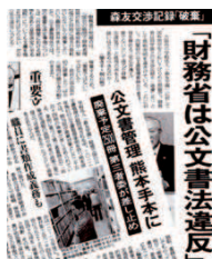
2017年5月23日および6月23日付 東京新聞朝刊記事

Q コンピューター導入には、 A コンピューター導入には、文書の検索が効率的になる