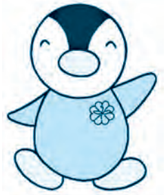
マスコットキャラクター「ミンジー」