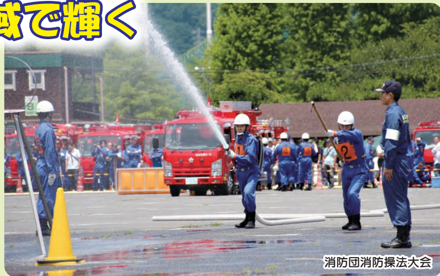
消防団消防操法大会