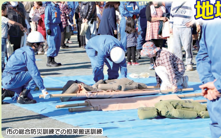
市の総合防災訓練での担架搬送訓練