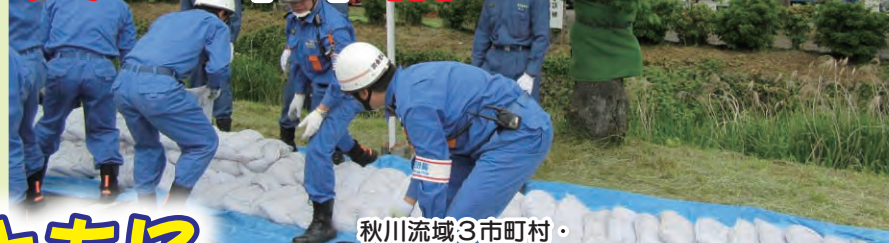
秋川流域3市町村・第九消防方面合同総合水防訓練での土のう訓練