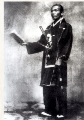
丸山惣兵衛(定静)