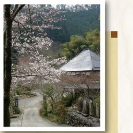
あきる野市乙津 511 番地

季節になるとウメや桜などの花木が境内を彩る。また、五日市七福神の寿老人が祀られており、見どころの一つとなっている。