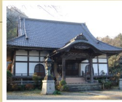
あきる野市戸倉 328 番地

臨済宗建長寺派。このあたりの禅宗寺院としては最も古い。本尊の釈迦如来は都指定有形文化財。境内に植えられているヤマザクラは、都の天然記念物。