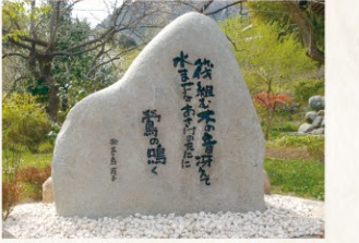
徳雲院にある歌碑

間を持ち、島木赤彦の門下となる。同年古泉千櫻の「青垣会」結成に参加するが、昭和2年(1927年)3月26日、麻布谷町(現在の六本木)の自宅で逝去。享年40歳。