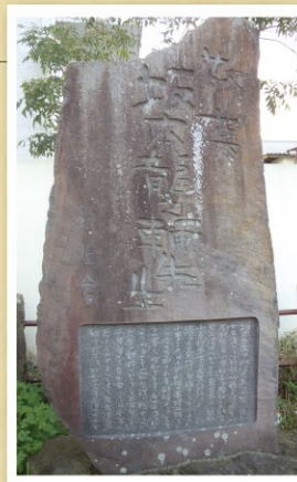
坂本龍之輔の功績を称えた敬慕碑が生家の一角にある。 あきる野市牛沼 80 番地

牛沼にある敬慕碑は、東京市万年尋常小学校を卒業した有志でつくる龍生会のメンバーによって、坂本龍之輔の功績を称え生家跡地の一角に建立された。また、東京市万年尋常小学校の校庭内には、やはり教え子有志によって「郷土の教育開拓者」と題し坂本龍之輔の銅像が建てられている。