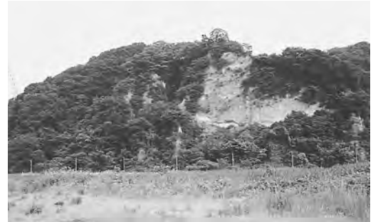
春には、頂上に山桜の花が咲き、桜が終わると、絶壁に紫つじの花、藤の花と続く、秋には、木の葉が紅葉し、赤・黄・橙のコントラストが美しい。

私の住んでいる引田地区は、近くに秋川が流れ、対岸には秋留丘陵がある。その丘陵の斜面が、その昔、秋川の大洪水の際、激流によって浸食されてできたと思われる六枚屏風岩は、六つの土柱が形成されて並列する特異な地形となっており、朝の散歩の際、秋川の河川敷に作られた遊歩道から眺める六枚屏風岩は、季節