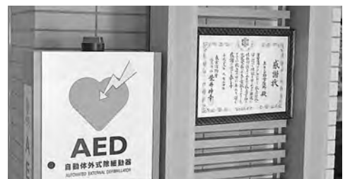
市役所1階に設置されているAEDと感謝状