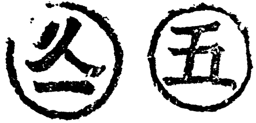
コックイ（刻印）、元締（材木商）の商標

父 資本家対労働者というほどでもないが賃仕事の機会には案外にあったといえる。それはともかく、入会山のために江戸時代を通じ山に対する個人の利権は複雑で不透