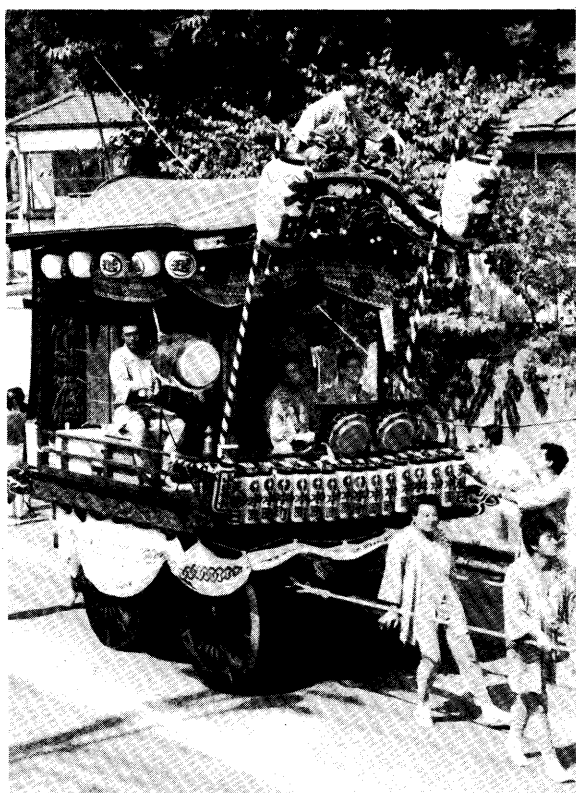
岩定神社例大祭(9月14~15日)における伊奈上宿(本町)の山車 1987.9.15