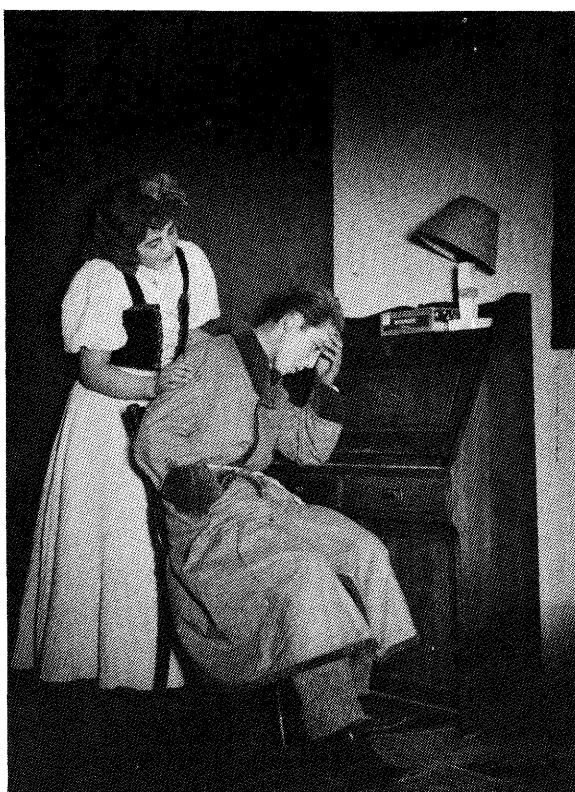
《地球座》の第一回公演“青春”の一場面