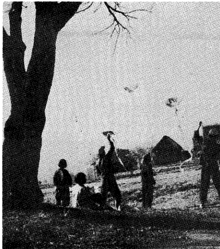
▲ 凧上げ こどもは風の子