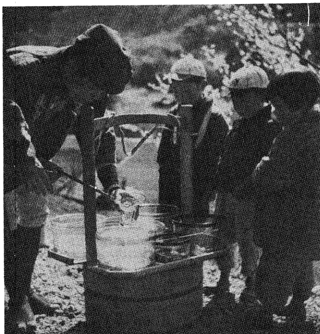
金魚売り 桃が咲く頃やってくる