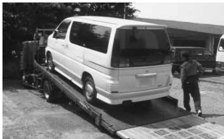
差し押さえた自動車の搬出

市の歳入予算は、市税や地方交付税、国庫支出金などがあり、皆さんが納めている市税の割合は、歳入全体の約4割を占めています。大半の方が納期内納税に協力していただいています。督促状が届いてから納める方もいるのが現実です。納め忘れを防ぐためにも、口座振替制度がたいへん便利です(申し込まれる方は、預貯金のある金融機関で手続きをしてください)。市役所窓口は、年末年始を 除いて、土曜・日曜日にも開いています。また、失業したり、家族が病気になるなど、納められない事情のある方には、納税相談も受け付けています。督促状を受け取って、納税も相談もしないと、勤務先へ給与額の照会や、自動車・不動産の所有状況、生命保険の状況を調べて、差し押さえをしたり、家宅捜索により財産を搬出して公売するなどの手続きに移ります。市では、滞納が放置され