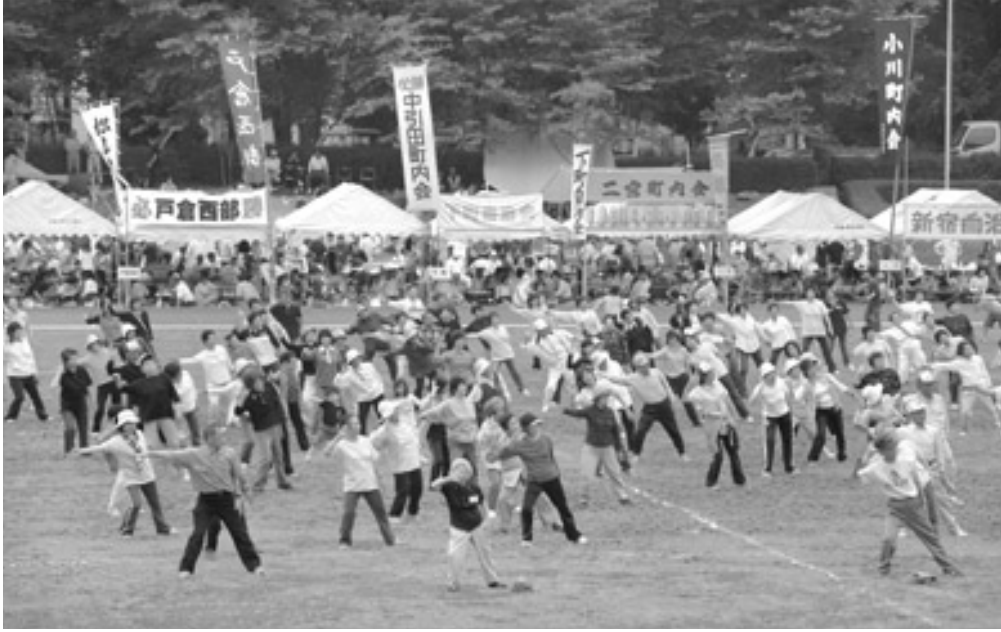
町内会・自治会の参加で行われる、スポーツ・レクリエーション大会