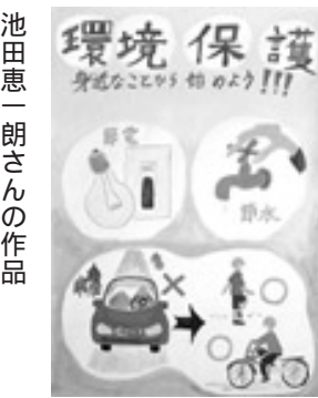
池田恵一朗さんの作品