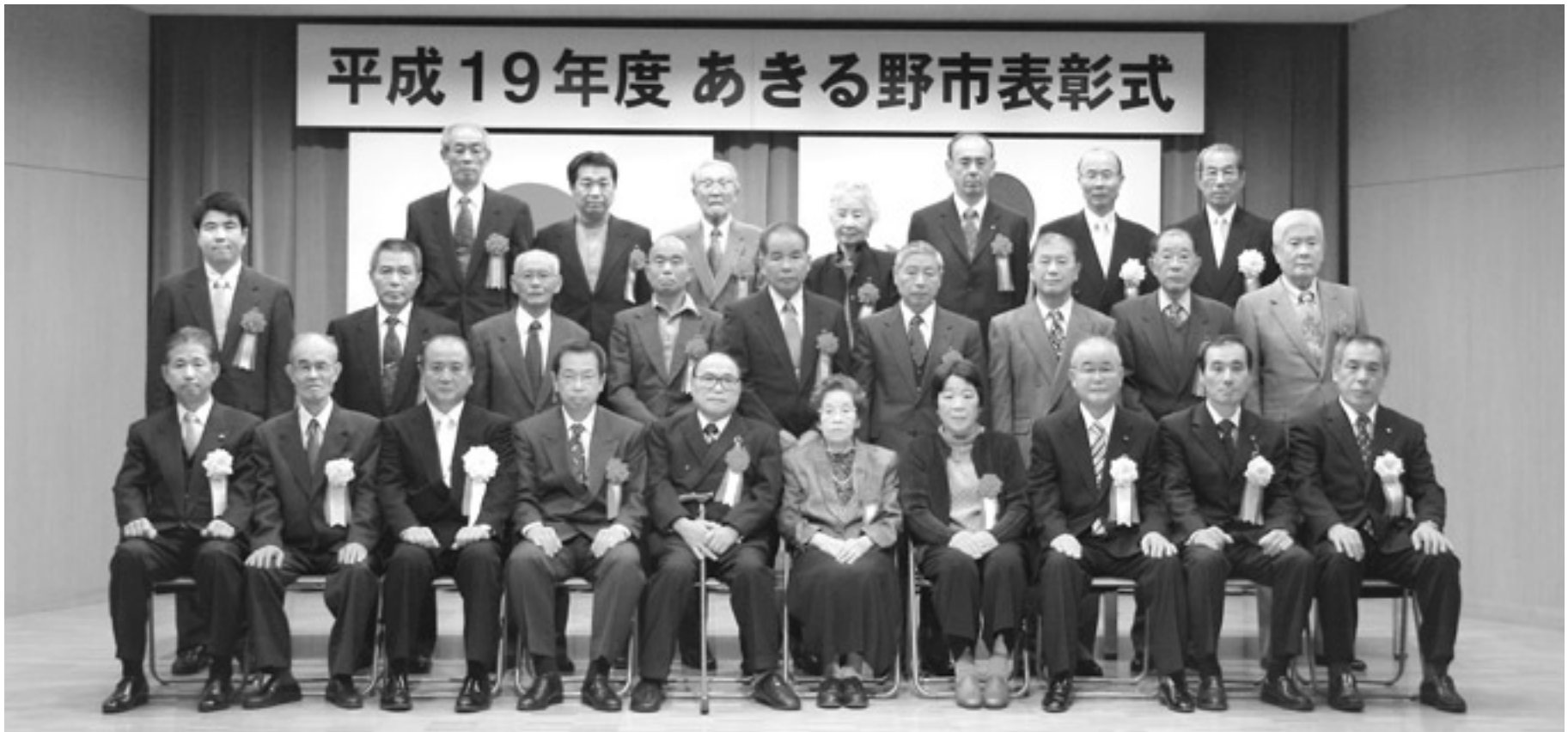
平成19年度 あきる野市表彰式

平成19年度の表彰式が、11月3日、まほろばホール(五日市地域交流センター3階)で行われ、各分野で功績のあった方々が表彰されました(敬称略、50音順)。