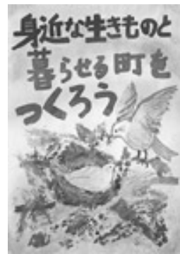
大場巴済さんの作品