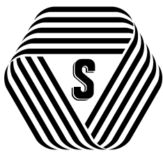
厚生労働大臣認可

標準営業約款制度は、法律で定められた消費者(利用者)擁護の制度です。厚生労働大臣認可の約款に従って営業することを登録した「理容店」、「美容店」、「クリーニング店」、「めん類飲食店」、「一般飲食店」では、店頭でSマークを表示しています。登録店は、安全、清潔、安心を約束する信頼できるものです。 問合せ(財)東京都生活衛生営業指導センター(03・3445・8751)へ