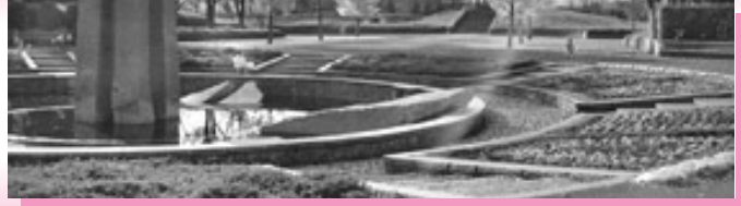
教室・講座・講習会のごあんない

期日 11月17日(土)(雨天中止) 集合時間・場所 午前8時15分 五日市ファインプラザ集合(午後4時30分解散予定)