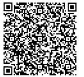
働く人、雇う人のための非正規労働セミナー&相談会 in 青梅