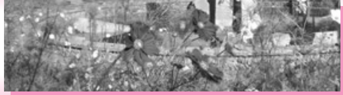
教室・講座・講習会のごあんない