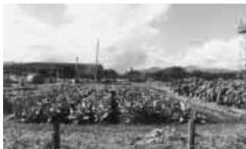
さくら通り（開発前）

この土地区画整理事業の完成後、12年の歳月をかけてまち並みは、当市の中心市街地として生まれ変わりました。