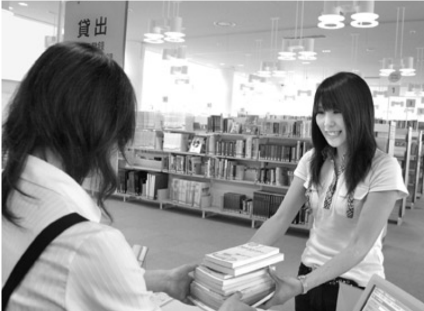
生涯学習の場としての図書館を大いに利用してください