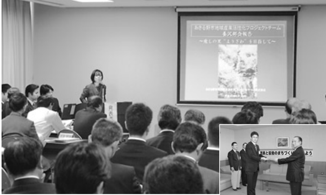
検討結果報告書の提出(写真右)後、発表会が行われました