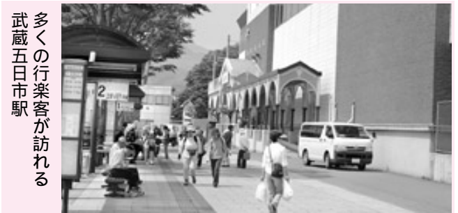
多くの行楽客が訪れる武蔵五日市駅

秋川駅北口部会では、あきる野市の商業の中心拠点である秋川駅北口地区について「にぎわい」を視点として、活性化策の調査・検討を行いました。五日市部会では、街道の町、市の町として栄えた五日市地区の商店街を中心に「東京のふるさと」としての活性化策について調査・検討を行いました。養沢部会では、山と清流に囲まれた養沢地区の観光推進など、「癒しの里」としての活性化策について調査・検討を行いました。