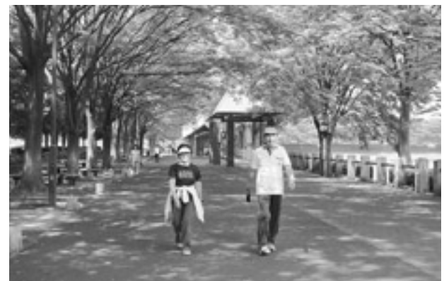
外に出て歩いてみましょう。新しい発見がきっとある

あきる野ふれあいマップは、皆さんが元気になるための計画。めざせ健康あきる野21計画の1つの取組として、市民が中心となって行政と協働で作成してき