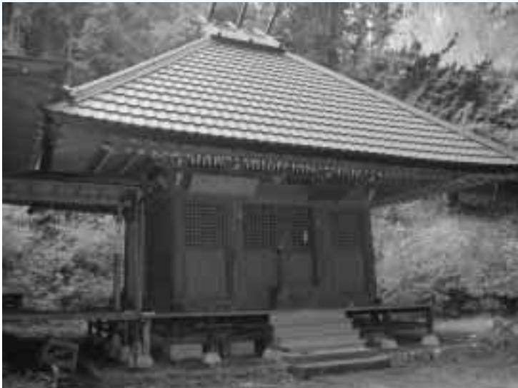
きしじまじんじゃ 貴志嶋神社 (網代83番地)

貴志嶋神社の創立は不詳ですが、社伝によれば、社号を弁財天と称し、現在でも俗に「網代の弁天様」と呼ばれています。また、天正18年(1590年)天下統一を進める豊臣秀吉の軍勢が、城主・北条氏照の八王子城攻略の際、寄手の上杉景勝・前田利家軍がこの弁財天の鐘を陣鐘として使用したという伝承があります。神社の南約50メートルに岩窟があり、そのなかに弁財天・羅紗門天等が祀っています。また、「貴志嶋神社石造大黒天像」は、市の有形文化財に指定されています。