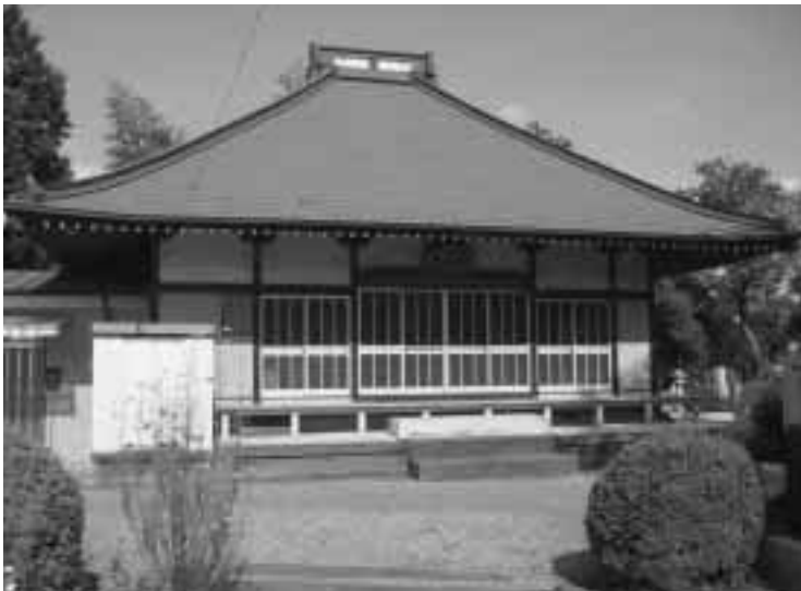
ぜんしやうじ 禅昌寺 (網代241番地)

貴志嶋神社の創立は不詳ですが、社伝によれば、社号を弁財天と称し、現在でも俗に「網代の弁天様」と呼ばれています。また、天正18年(1590年)天下統一を進める豊臣秀吉の軍勢が、城主・北条氏照の八王子城攻略の際、寄手の上杉景勝・前田利家軍がこの弁財天の鐘を陣鐘として使用したという伝承があります。神社の南約50メートルに岩窟があり、そのなかに弁財天・羅紗門天等が祀っています。また、「貴志嶋神社石造大黒天像」は、市の有形文化財に指定されています。