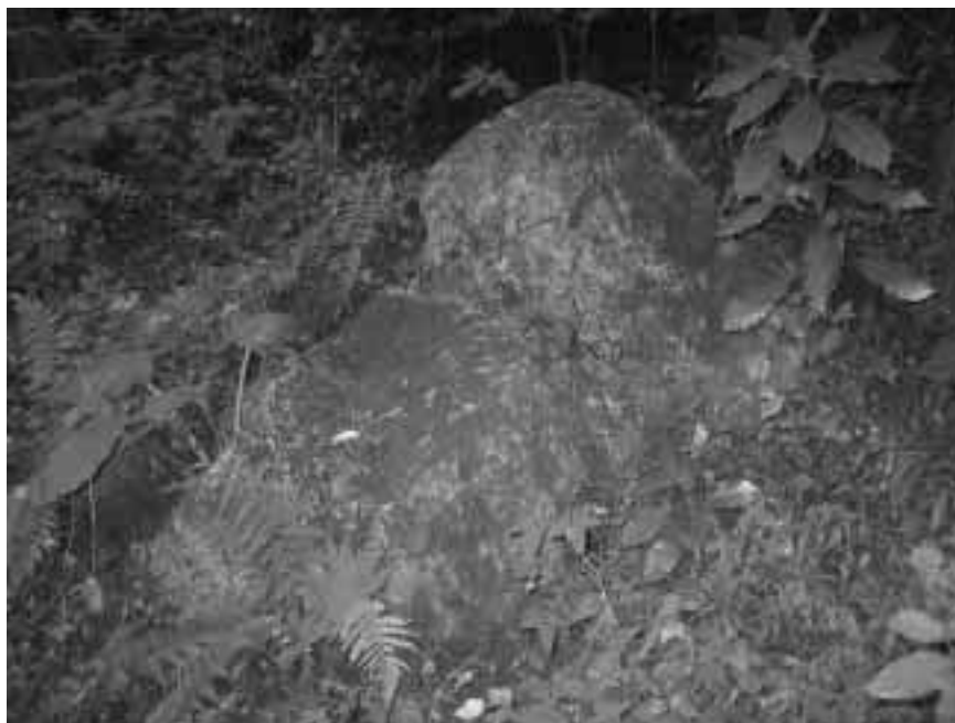
御前石 ごぜんいし

網代は、魚の良く集まる場所で、漁場などを表わす言葉とされています。網代は、清流秋川の中で、漁場としてたいへん恵まれた場所であったと見られています。また、中世から近世にかけては、御前石付近で「鎌倉街道」と「古甲州道」が交わる重要なポイントでもあったとの記述が「五日市町の古道と地名」にあります。