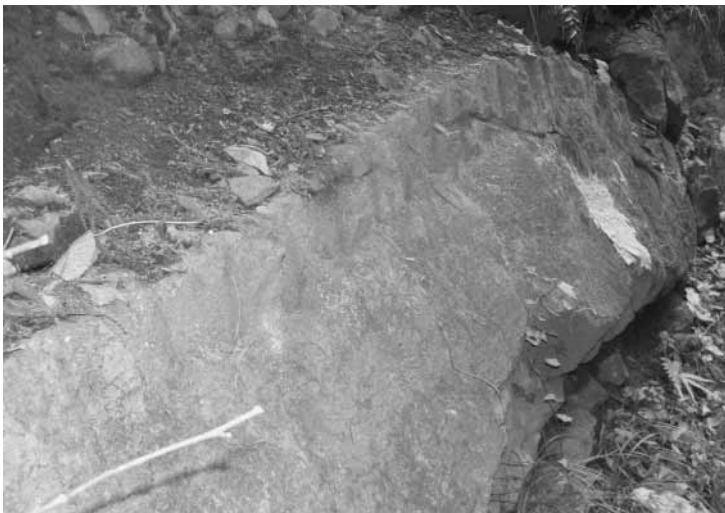
伊奈石の石切場跡