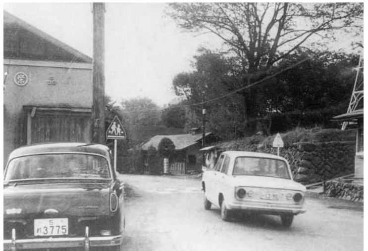
伊奈旧道・増戸会館下（昭和30年頃）

「伊奈みち」は、秋川の谷と江戸とを結ぶ道で、秋川の北岸の油平・雨間・野辺を経て小川の渡しを通り、福生市熊川・立川市砂川・武蔵野市吉祥寺と、武蔵野の最短距離を東へ横切って、現在の杉並区で青梅街道に合流します。伊奈宿は石材関係職人の往来に伴う宿場の発展により、日用物資取引きの中心となり、秋川谷の代表集落となりました。その後、炭取引きを中心とした五日市宿が発展するにつれ、五日市街道と呼ばれるようになったとの記述があります。また、「いなみち」と刻まれた自然石の道しるべが、立川市の砂川（天王橋）に残されていましたが、道路改修工事により、立川市歴史民俗資料館に移され現存しています。